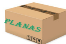
120 pares caja 120 pairs box