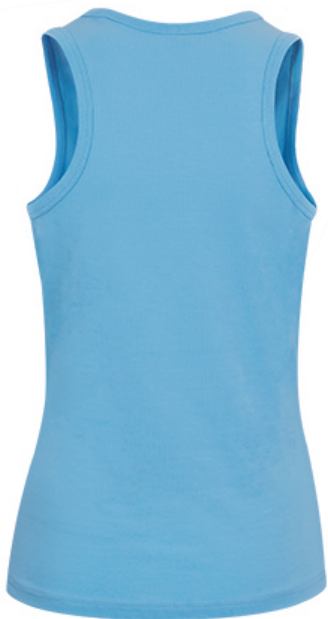
Vue de dos du vêtement