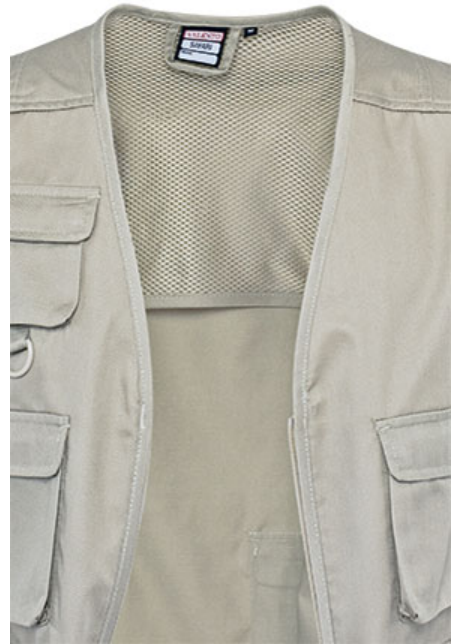
Detalle bolsillo inferior trasero con tapa