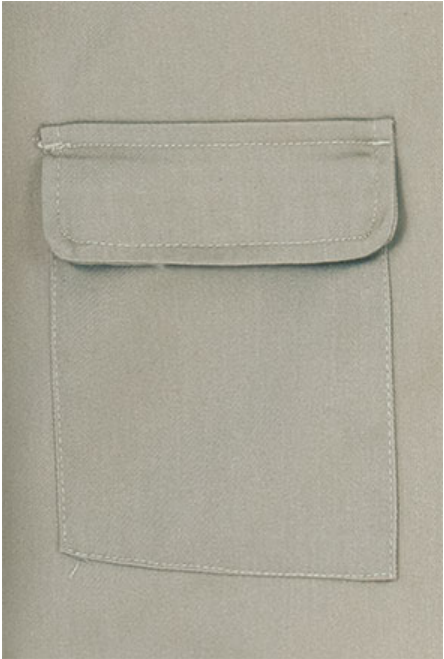
Detalle bolsillo inferior trasero con tapa