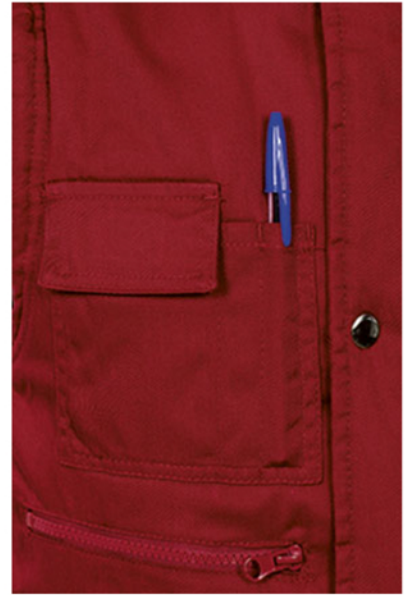
Detalle bolsillo en pecho derecho