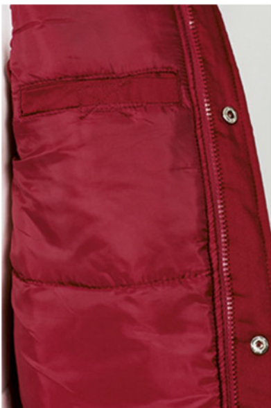
Detalle bolsillo interior en pecho izquierdo