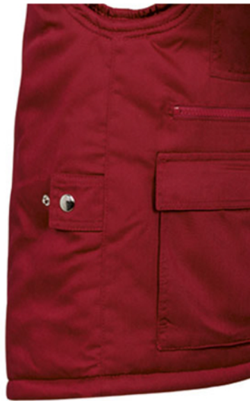
Vista lateral: espalda más larga