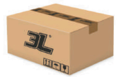
72 pares caja 72 pairs box