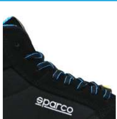
CINTA DE TEAMWORK cosida en la lengüeta (15x60mm) ESD LABEL en las trabillas de los cordones.