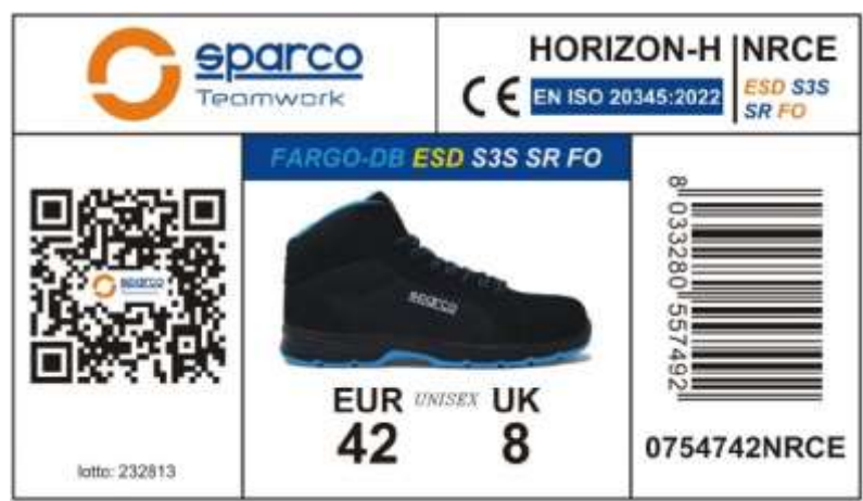
CAJA DE ETIQUETAS EXTERIOR aplicado en el lado preparado de la caja, muestra las características del producto, certificación, número de lote, código de producto, código QR y código de barras. Dimensiones: 105x60 mm