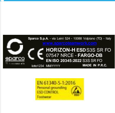
ETIQUETA "CE" en el interior de la lengüeta (50 x 15 mm) ETIQUETA ESD EN 61340-5-1:2016