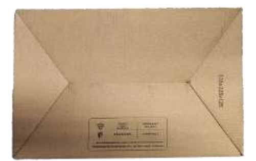
CAJA DE ZAPATOS Cartón neutro y papel de seda interior protector. Dimensiones: 355x255x125 mm Indicaciones de reciclaje válidas para ITALIA en la parte inferior (PAP20)