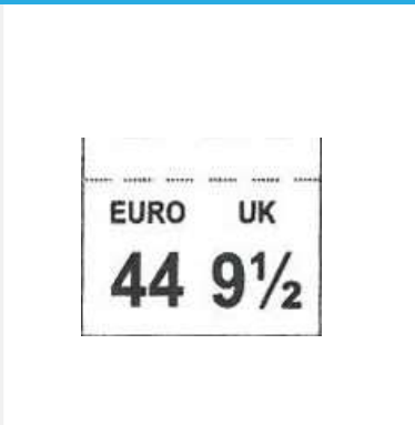
ETIQUETA DE TAMAÑO cosido entre la parte superior y la lengüeta Dim 17 x 14 mm