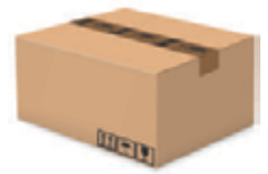
120 pares caja 120 pairs box